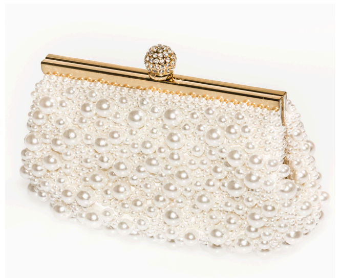
Vytvořila Romana Rochovanská v Canvě, 2026