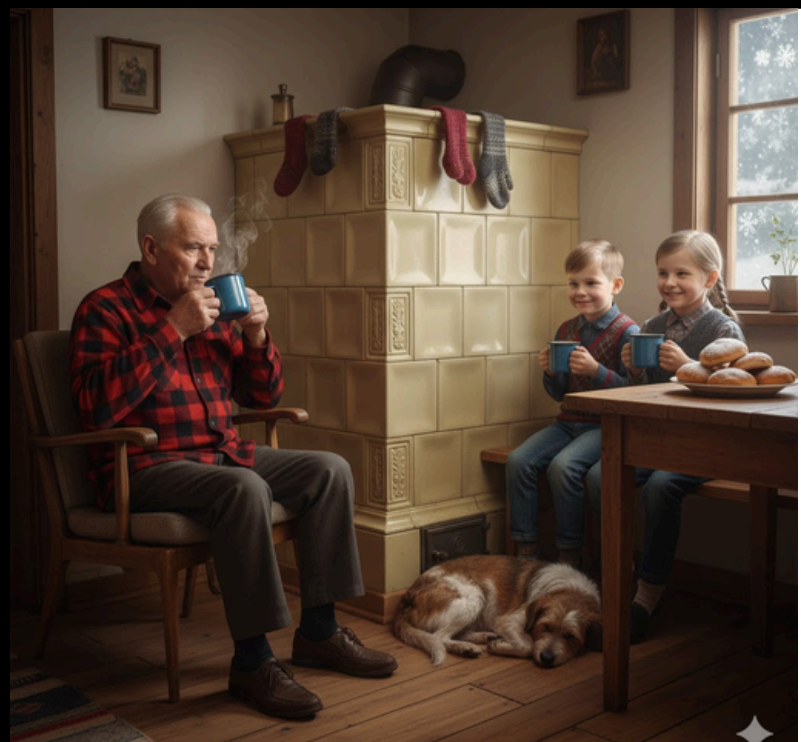
Vytvořila Romana Rochovanská v Canvě a Gemini, 2026