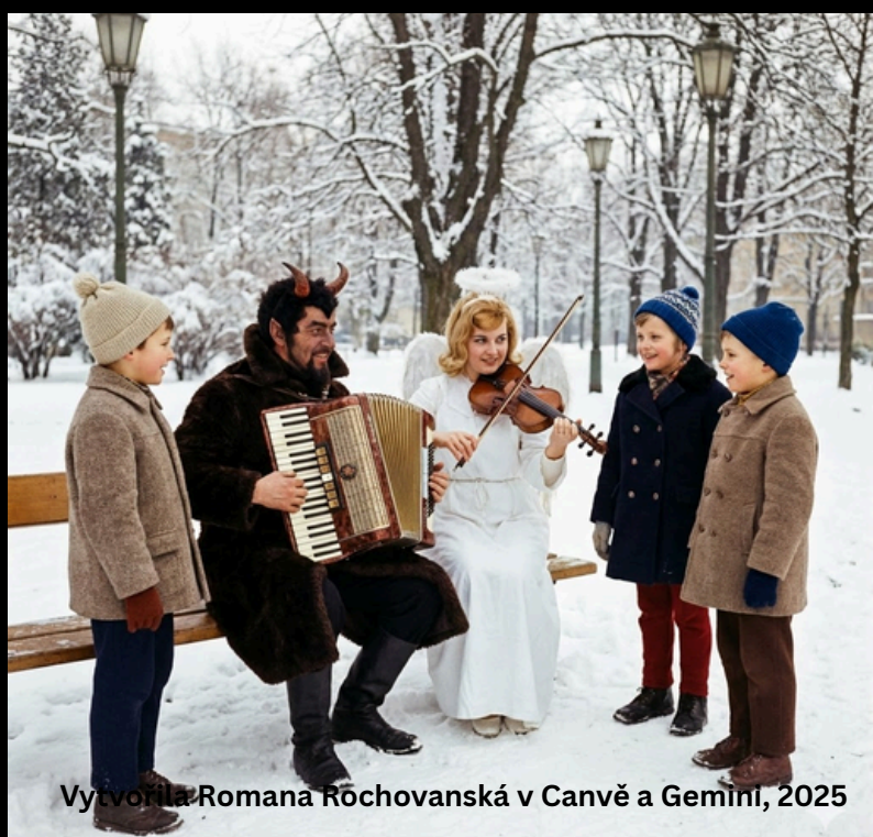
Vytvorila Romana Röchovanská v Canvě a Gemini, 2025