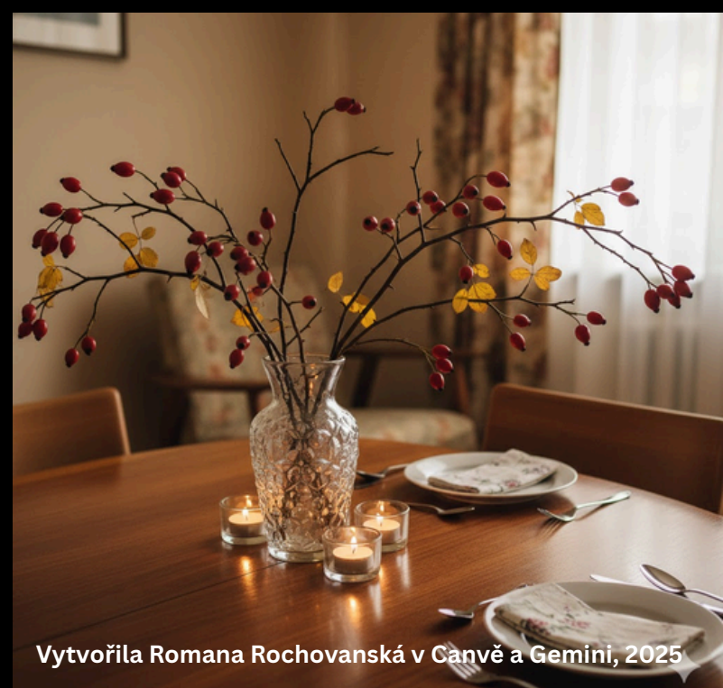
Vytvořila Romana Rochovanská v Čanvě a Gemini, 2025