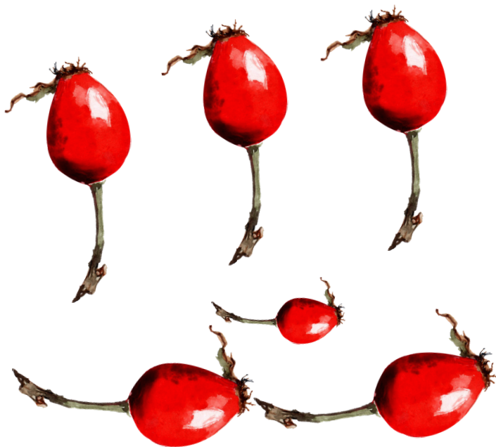
Vytvořila Romana Rochovanská v Canvě, 2025